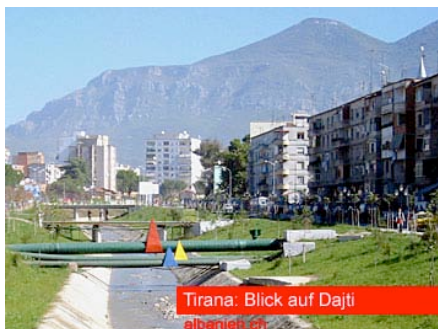
Blick auf Dajti

Der „Dajti“ bietet eine gute Möglichkeit, um dem regen Treiben von Tirana zu entfliehen. Die Sicht über Tirana und Umgebung ist vor allem bei klarem Wetter eindrucklich – mit etwas Glück ist sogar die Adria zu sehen. Zahlreiche Restaurants bieten Kaffee und Snacks an. Am Wochenende sind hier viele Albaner selbst beim Picknick anzutreffen. Der Berg kann auch zu Fuß erkundet werden. Weite Teile des Berges sind jedoch militärisches Sperrgebiet. Bei der Bergstation der Seilbahn sind einige Wanderwege ausgezeichnet – ambitionierte Bergwanderer können sogar den Wegweiser folgend bis zum Gipfel des Berges (1612 Metern) hochsteigen. Auch Klettern, Gleitschirmfliegen und Wintersport sind möglich.