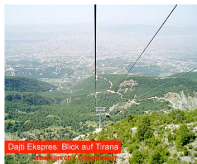
Ausblick auf Tirana