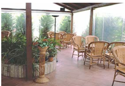
Pavillon im Garten