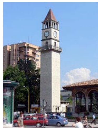
Uhrturm „Kulla e Sahitit“