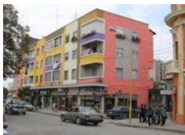
Bunt gestaltetes Haus