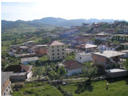
Blick vom Balkon des Hotels